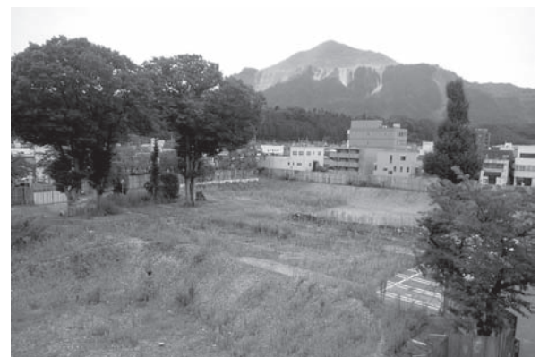
9月19日現在の建設予定地

ただし、 市民負担を増やすことのないよう 、合併特例債の活用額や公共施設整備基金の投入額などについて財源の調整を行い、また、新規の国庫補助事業を組み合わせるなどして、市の財政負担を軽減できるよう進めます。