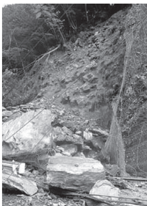
7/20に発生した大滝大久保地内の土砂崩れ